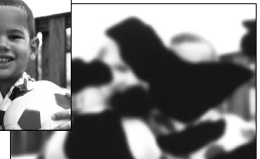
La misma escena vista por una persona con retinopatía diabética.